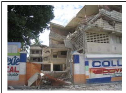
Collège Eddy Pascal effondré